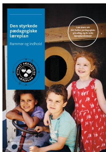
Den styrkede pædagogiske læreplan, Rammer og indhold

Denne skabelon indeholder alle de lovmæssige krav til evalueringen. Lovkravene finder I i de to midterste afsnit "Evaluering og dokumentation" og "Inddragelse af forældrebestyrelsen". Skabelonen indeholder desuden spørgsmål, som kan støtte jeres evalueringsproces samt jeres fremadrettede arbejde med løbende at revidere den skriftlige læreplan.